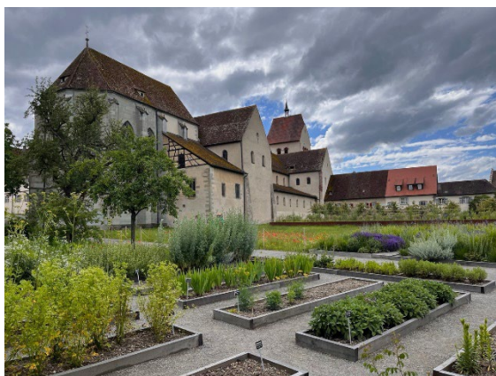
Plates-bandes des jardins du couvent de Reichenau.

Le site Internet du groupe de travail est en cours de révision. En complément, un atelier portant sur la thématique de la diffusion de l'information a été organisé. L'objectif vise à améliorer l'information concernant la liste et les autres prestations offertes par le groupe de travail, ainsi qu'à sensibiliser la population au bien culturel que constituent les parcs et jardins historiques. Le nouveau site Internet doit être opérationnel début 2025. En juillet, le groupe de travail a visité les nouveaux jardins du couvent de l'île de Reichenau sur le lac de Constance, qui font partie de l'importante exposition organisée par le Land du Bade-Wurtemberg.