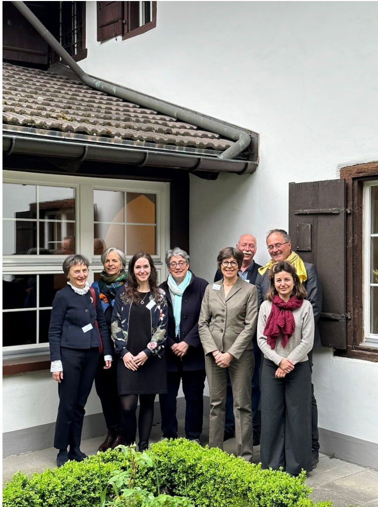
nouvelle composition du comité